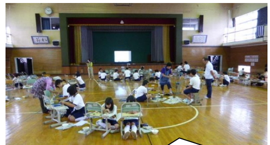
陶芸体験の様子～グループ毎に体験します～