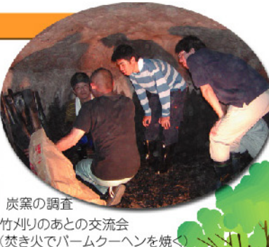
炭窯の調査 竹刈りのあとの交流会 (焚き火でバームクーヘンを焼く)