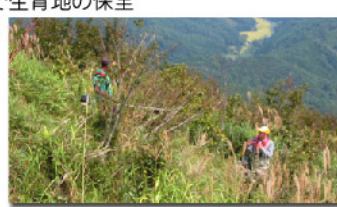
希少種生物の生育環境保全活動