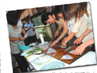
海の幸の料理教室