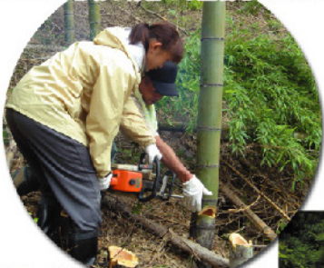
農林漁業体験の指導