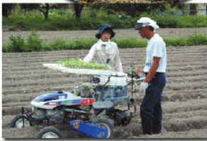
農作業体験の指導(里山インターシップ)