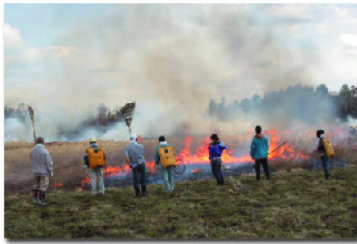
毎年3月は三瓶山野焼きに参加