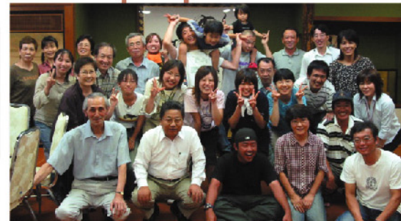
里山インターシップを支える多勢のボランティアスタッフたちと