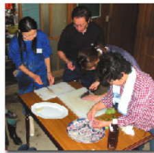
山の幸の料理教室