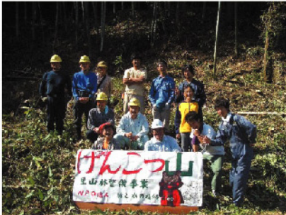
森林組合、大学研究室との共同作業