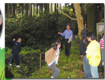
三瓶川の水源地探索