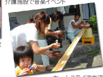
ホームステイで交流