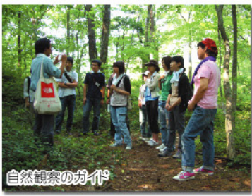
自然観察のガイド

NPO法人緑と水の連絡会議は、アウトドアでのボランティア活動フィールドを年間を通じて提供しています。