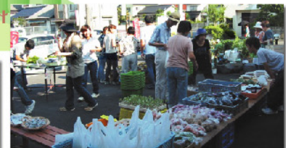
地産地消をすすめる朝市の開催