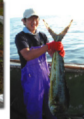
本格的漁業体験も好評