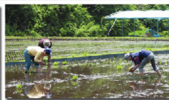
放棄水田を復田し交流の場になっています