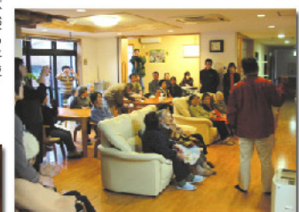
介護施設で音楽イベント