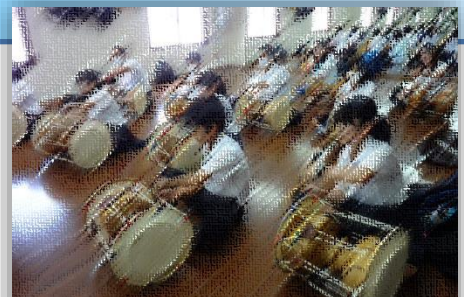
和太鼓とは、たたき方が違うチャンゴ