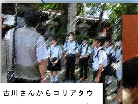
古川さんからコリアタウンの説明を聞いています。

学校では1回ただただだったけど、コリアタウンでちゃんと習ってみんなでたたくと、音がそろって歌になっていたことに感動しました。