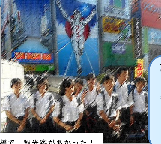
心齋橋で。観光客が多かった！

次の日自分たちだけでホテルまで帰らないといけないので、道を覚えるのに必死でした。初めてグリコを見たので、テンションがあがりました。