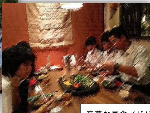
豪華な昼食（ビビンバ御膳）