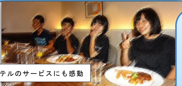
ホテルのサービスにも感動

サッカーの試合を見ていました。でも日本は負けてしまいました。大阪の夜は外も明るかったです。