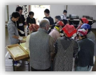
西南中で楽しみ、西南中を懐かしむ交流の輪が、体育館いっぱいになり、広がりました。