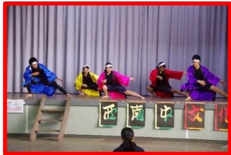
オープニング「西南ソーラン」