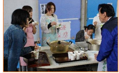
P.T.A.の皆さんが、学校農園で採れたサツマイモをみそ汁に!