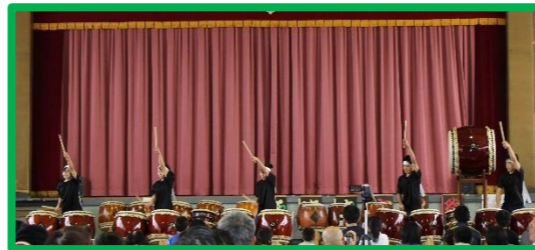
和太鼓演奏 5人で音楽会の演奏を披露