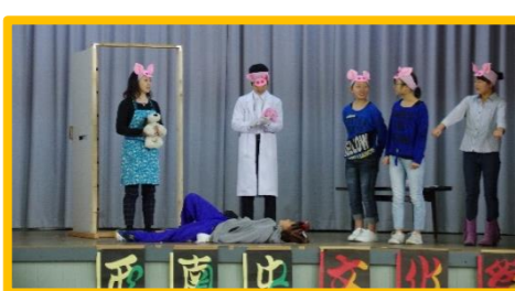
全校劇「ぶた一家とオオカミ」生徒・教職員全員が参加!