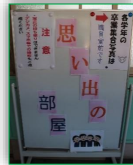
学校に保管されていた昭和30年代から昨年度までの写真を展示しました。好評につき、3月まで展示します。見学ご希望の方は、学校に連絡をお願いします。