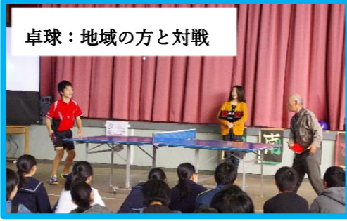
卓球：地域の方と対戦