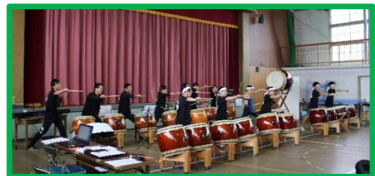
後半は職員も加わりました