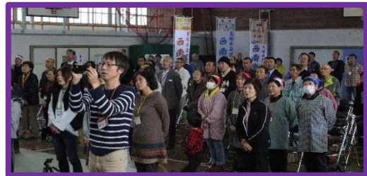
校歌 卒業生の皆さんも一緒に斉唱