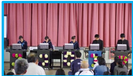
最後は全校合奏を披露