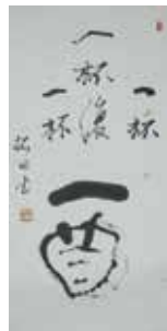
渡辺拓田「酒」 個人蔵

字を絵画風に表現するなど、親しみやすい作品で知られる、益田市出身の書道家・渡辺拓田(1911~1992)の作品を公開します。