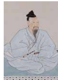
「益田宗兼像」(部分) 医光寺蔵