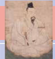
雪舟等楊《益田兼俊像》(部分) 重要文化財

中世の益田・益田氏と京都・室町幕府との交流を、優れた文化遺産とともに紹介します。(主催: 益田の歴史文化を活かした観光拠点づくり実行委員会)