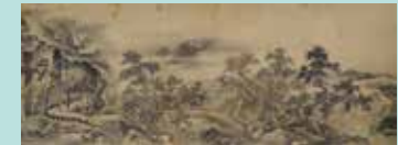
狩野惟信《雪舟筆山水図巻模本》(部分)

雪舟はその生涯、どんな人物と交友があったのか、雪舟周辺の人物相関図と、絵画から読み解く雪舟の交友関係に焦点を当て紹介します。