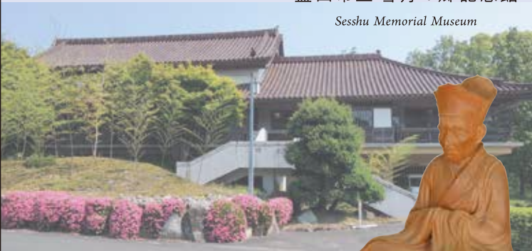
高村光雲《雪舟禅師像》市指定文化財