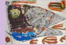
《こいこいこいのぼり》