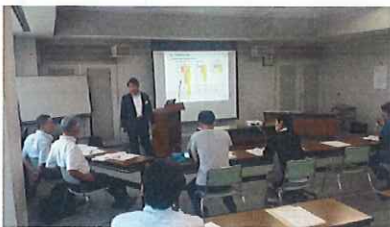
ワークショップ風景(イメージ)